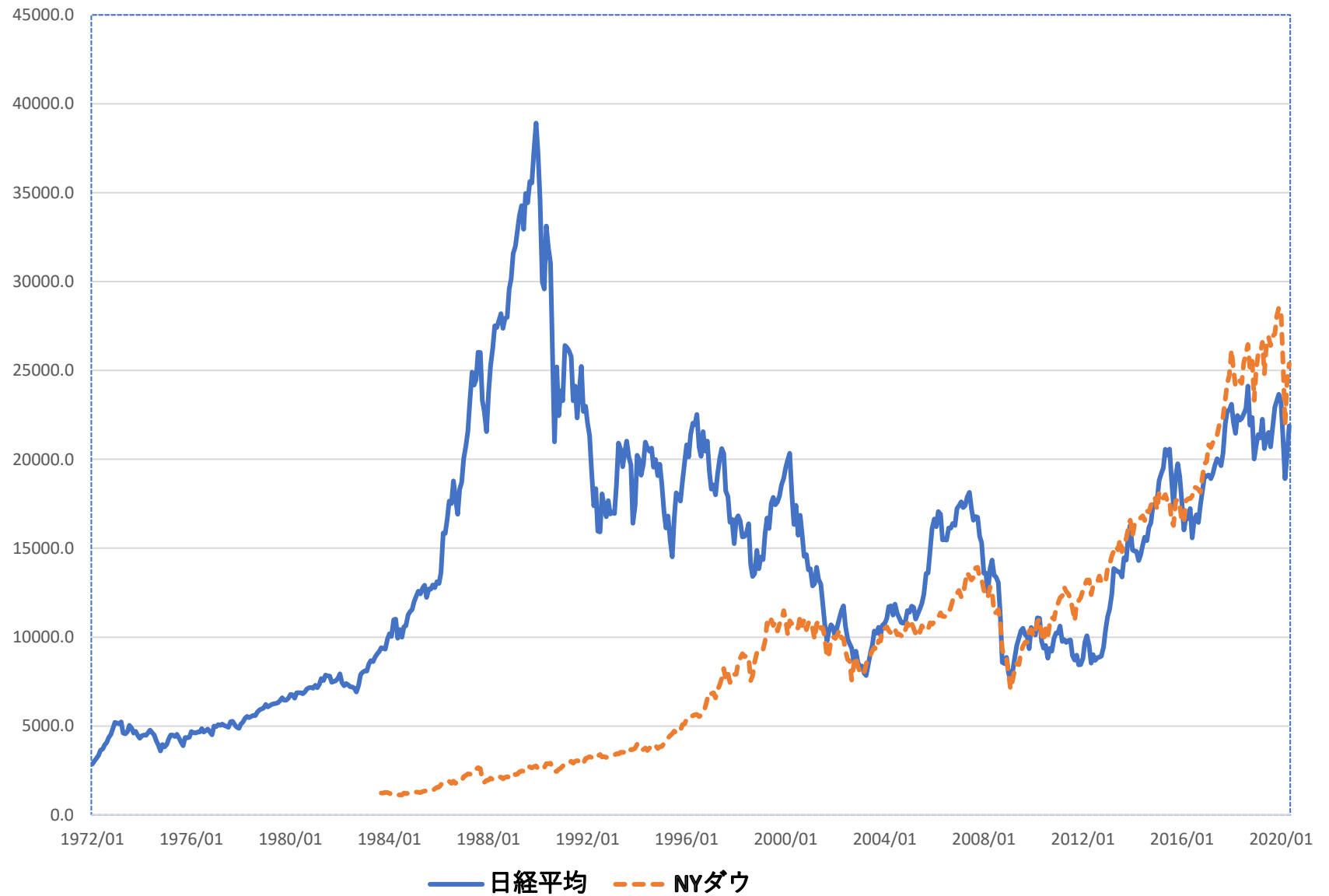
図4-4 日経平均とNYダウの推移 (1972年1月～2020年5月)