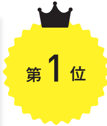
『刑事訴訟法』 酒巻 匡 (有斐閣 本体¥4000)