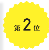
『民事訴訟法 判例百選〔第5版〕』 高橋宏志ほか編 (有斐閣 ¥2800)